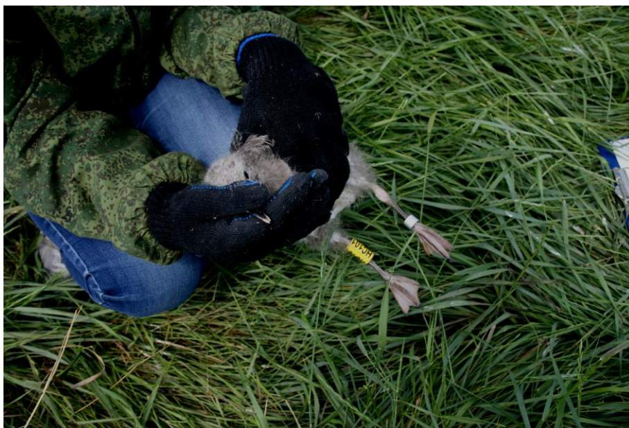
Окольцованный птенец омской белоголовой чайки-хохотуньи, который зимовал в этом году на Аравийском море западного побережья Индии

Также в 2016 году впервые установлено место зимовки окольцованных желтыми кольцами белоголовых чайк-хохотуний из особо охраняемой природной территории регионального значения природный парк «Птичья гавань» на западном побережье Индии (4600 км дистанции перелета).