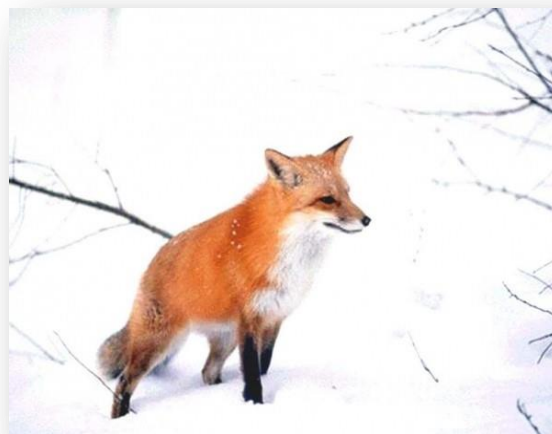
Лисица обыкновенная ( Vulpes vulpes )

Заказник создан недавно, тем не менее, здесь можно наблюдать большое разнообразие птиц, например, в этом году на территории заказника были отмечены шесть пар орлана-белохвоста ( haliaeetus albicilla ), более 15 пар серого журавля ( grus grus ), лебеди-кликуну ( cygnus cygnus ), на озёрах отмечались залёты кудрявых пеликанов ( pelecanus crispus ), на территории Называевского района отмечен белый аист ( ciconia ciconia ). Основной объект для охраны здесь косуля сибирская ( capreólus pygárgus ), на этой территории расположены места нагула, отёла и зимних стоянок копытных животных.