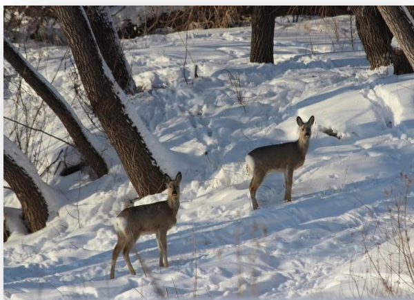
Косуля сибирская ( Capreólus pygárgus )

снизилась, что положительно сказалось на условиях обитания различных видов диких травоядных животных. Через заказник проходят пути сезонных миграций различных видов зверей и птиц. На территории заказника обитают охотничьи животные, в том числе лось ( alces alces ), кабан ( sus scrofa ), косуля сибирская ( capreólus pygárgus ), лисица обыкновенная ( vulpes vulpes ), корсак ( vulpes corsac ), енотовидная собака ( nyctereutes procyonoides ), барсук ( meles meles ), заяц-беляк ( lepus timidus ), куница лесная ( martes martes ), колонок ( mustela sibirica ), хорь ( mustela putorius ), горноста́й ( mustela erminea ). Состав орнитофауны включает около 60% видов птиц, зарегистрированных в Омской области.