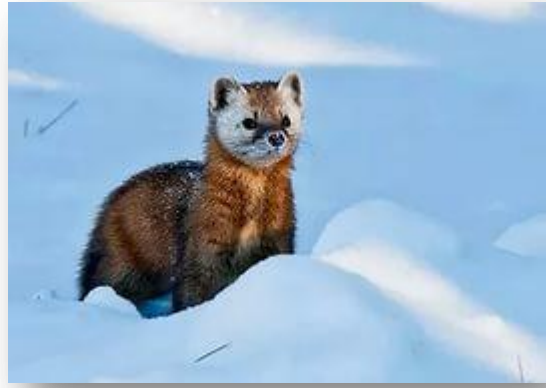
Куница ( Martes )