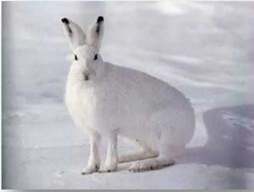
Заяц-беляк ( Lepus timidus )