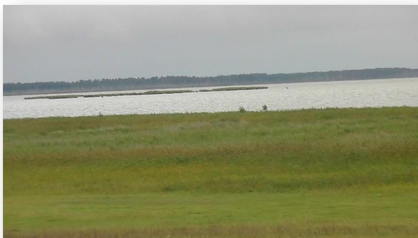
Острова-сплавина на озере Тенис

Озеро Тенис относится к Иртышской озерно-речной системе, на западе соединено Балашовским проливом с озером Салтаим. Ширина протоки около 2 км. В озеро Тенис впадают реки: Карасук, Балка сухая, Тлеутсай. На севере из озера Тенис вытекает река, которая впадает в озеро Ачикуль, из которого берет начало река Оша. Вокруг озера Тенис располагается система мелких озер с тростниковыми островами. Пойма шириной 0,1 -1,0 км, на северо-западе и юго-востоке переходит в болото. Общая площадь совместно с озером Салтаим составляет 5710 км 2 . Поверхность водосбора равнинная, слабо пересеченная.