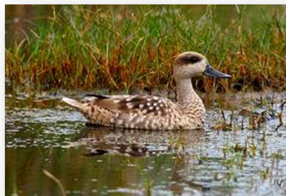
Мраморный чирок ( Marmaronetta angustirostris )

Основной объект для охраны заказника это кудрявый пеликан ( pelecanus crispus ). Ежегодно здесь совместно с учёными, егеря и специалисты проводят кольцевание птиц и учёт численности пеликанов.