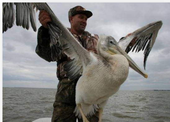
Кудрявый пеликан (Pelecanus crispus)

Согласно положению о государственном природном заказнике регионального значения «Пеликаньи острова» на его территории запрещается: охота и рыболовство, добыча объектов животного мира и иная деятельность, если она противоречит целям создания заказника, причиняет вред природному комплексу заказника и его компонентам, кроме случаев, связанных с проведением мероприятий, предусмотренных пунктом 7 настоящего Положения; нахождение в период с 1 мая по 15 августа плавучих средств и граждан на расстоянии ближе 500 м от мест гнездования кудрявого пеликана, за исключением работников Министерства и бюджетного учреждения Омской области «Управление по охране животного мира» при выполнении ими должностных обязанностей, а также граждан, участвующих в проведении мероприятий, предусмотренных пунктом 7 настоящего Положения; сбор зоологических и ботанических объектов; повреждение информационных знаков, плакатов и других объектов инфраструктуры заказника.