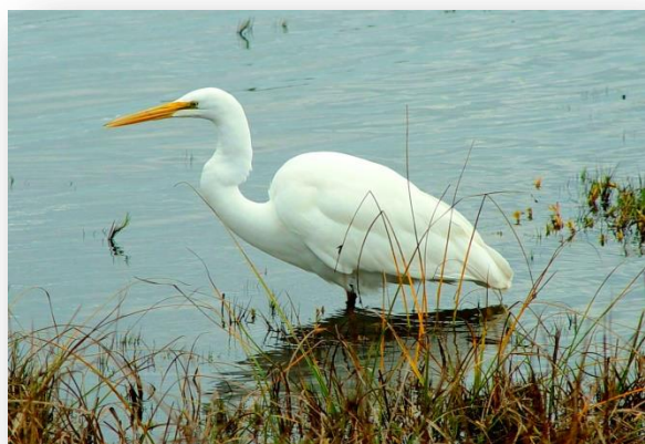
Белая цапля ( Ardea alba )

Также здесь можно встретить редких животных, которые занесены в Красную Книгу Омской области: тритон обыкновенный ( Lissotriton vulgaris ), жаба серая ( Bufo bufo ), обыкновенный уж ( Natrix natrix ), чернозобая гагара ( Gavia arctica ), серощёкая поганка ( Podiceps grisegena ), кудрявый пеликан ( Pelecanus crispus ), розовый пеликан ( pelecanus onocrotalus ), белая цапля ( ardea alba ), лебедь-шипун ( cygnus olor ), мраморный чирок ( marmaronetta angustirostris ), краснозобая казарка ( branta ruficollis ), гусь пискулька ( anser erythropus ), красноносый нырок ( netta rufina ), шилоклювка ( recurvirostra avosetta ), большой улит ( tringa nebularia ), тонкоклювый кроншнеп ( numenius tenuirostris ), большой кроншнеп ( numenius arquata ), речная выдра ( lutra vulgaris ). Стоит отметить, что на территории заказника встречается черноголовый хохотун ( larus ichthyaetus ), который занесен в Красную книгу Российской Федерации.